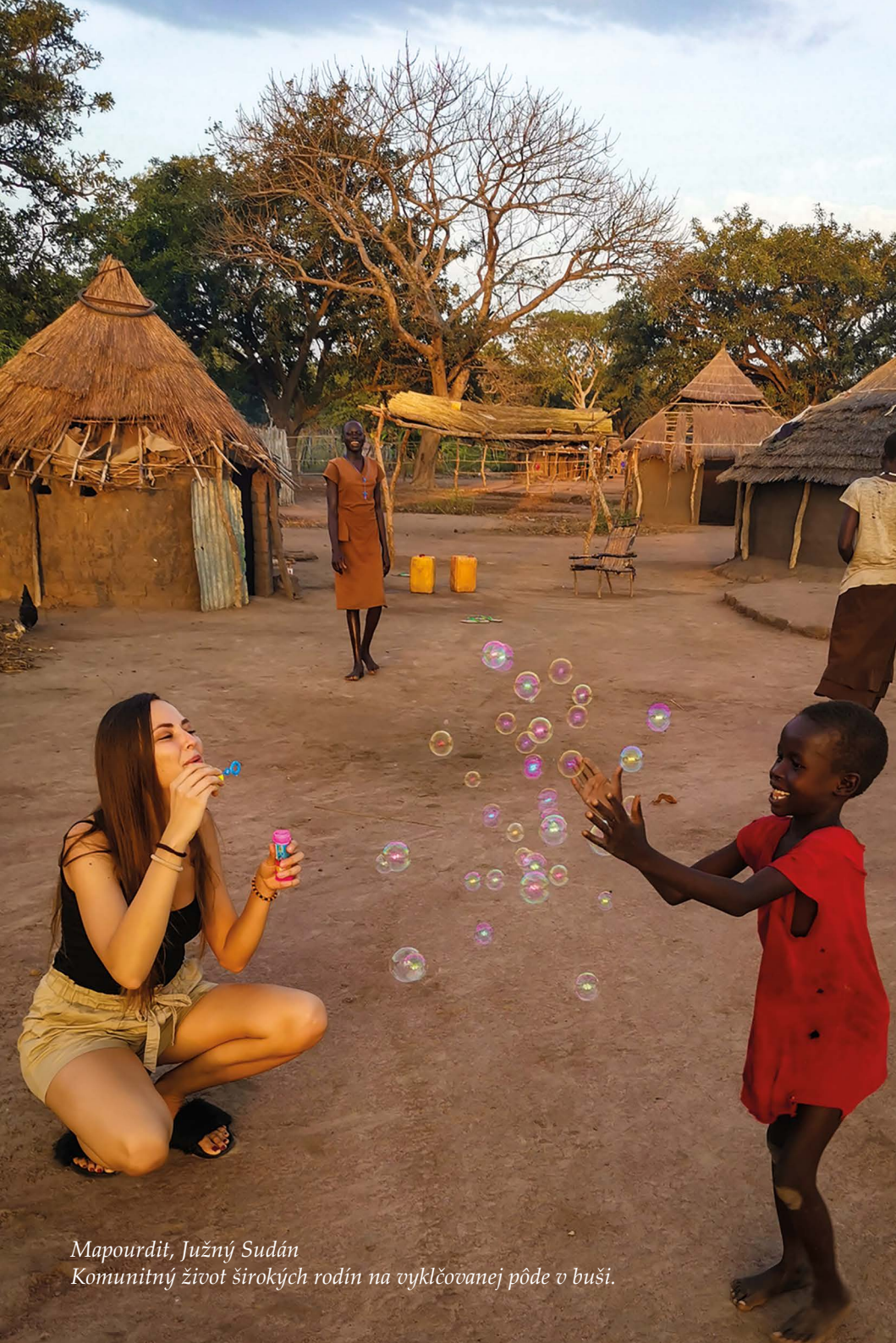
Mapourdit, Južný Sudán Komunitný život širokých rodín na vyklčovanej pôde v buši.